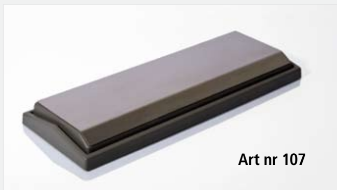
Art nr 107