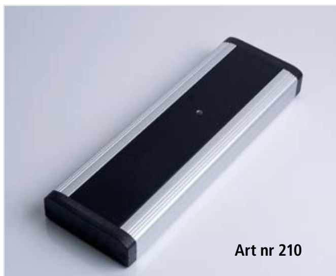
Art nr 210