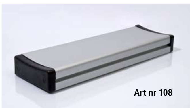
Art nr 108