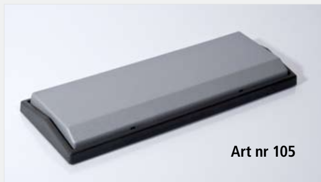
Art nr 105