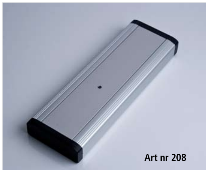
Art nr 208