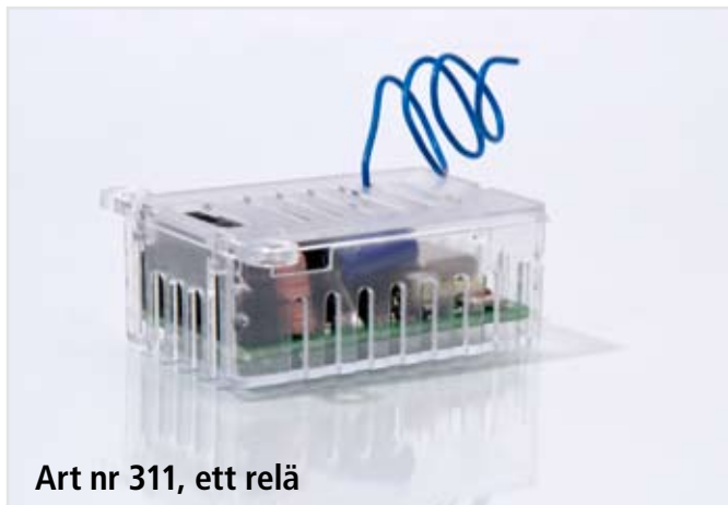
Art nr 311, ett relä