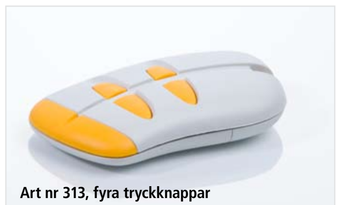
Art nr 313, fyra tryckknappar