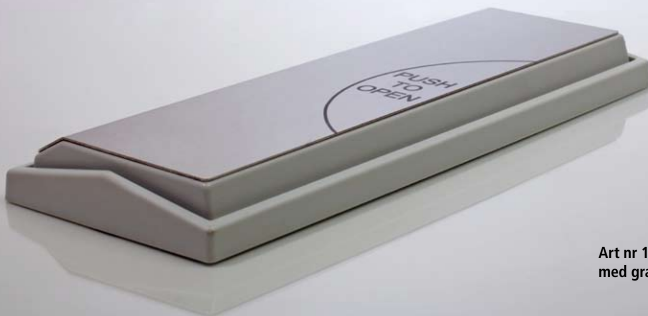
Art nr 107 med gravyr

Samtliga kontakter i 100-serien går att få med radiostyrning!