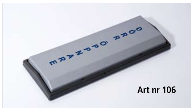
Art nr 106