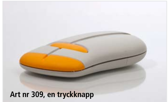
Art nr 309, en tryckknapp

Frekvens: 433,92 AM MHz Batterityp: 12V L1028 eller 23A Batterilivslängd: 2-3 år Strömförbrukning: 25 mA Räckvidd: 150-250 m Dimension: 80 x 46 x 16 mm Vikt: 40 g