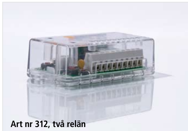
Art nr 312, två relän