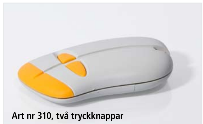
Art nr 310, två tryckknappar