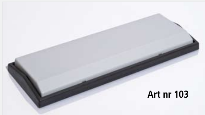
Art nr 103