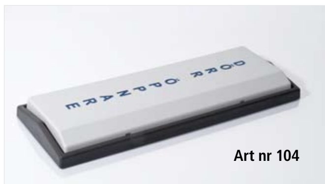
Art nr 104